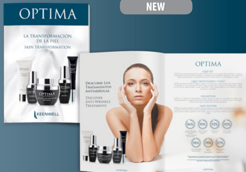
Catálogo Optima 2018 Catalogue Optima 2018