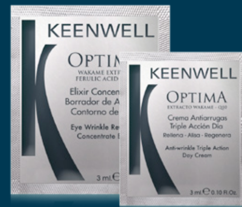
Muestra Elixir Concentrado Borrador de Arrugas Contorno de Ojos Eye Wrinkle Reverter Concentrate Elixir