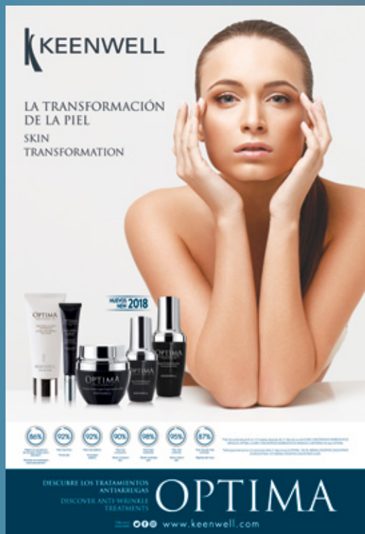
Póster Optima 2018 Floor Stand Optima 2018